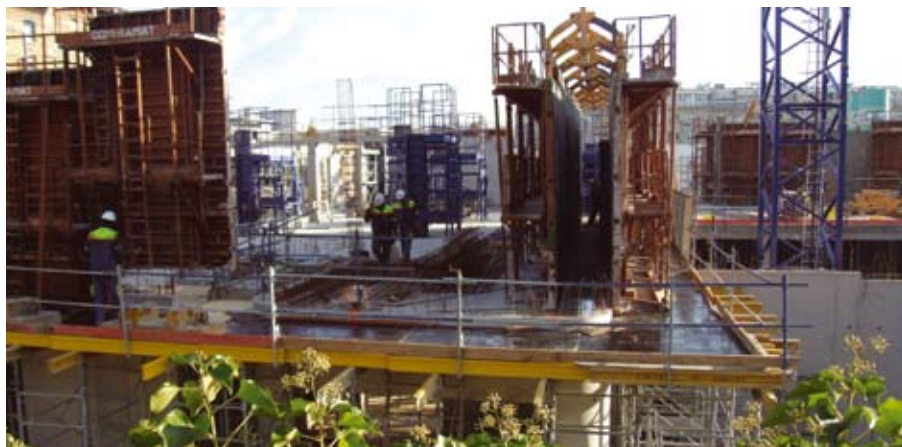
Novembre 2008 - le 4 e niveau (sur 8) est sorti de terre.

Cette photo des travaux illustre bien l'avancement du chantier de l'ICM. Le gros œuvre de 4 niveaux du futur du bâtiment est déjà terminé, ce qui permet d'ores et déjà de visualiser la distribution des pièces et l'emplacement de certains gros équipements : espace logistique (stockage du matériel et des consommables, aire de livraisons), plateforme de 1200 m 2 dédiée à la neuroimagerie (salles IRM), le hall d'accueil et l'amphithéâtre (180 places) du rez-de-chaussée haut. D'ici cet été, les 8 niveaux seront sortis de terre.